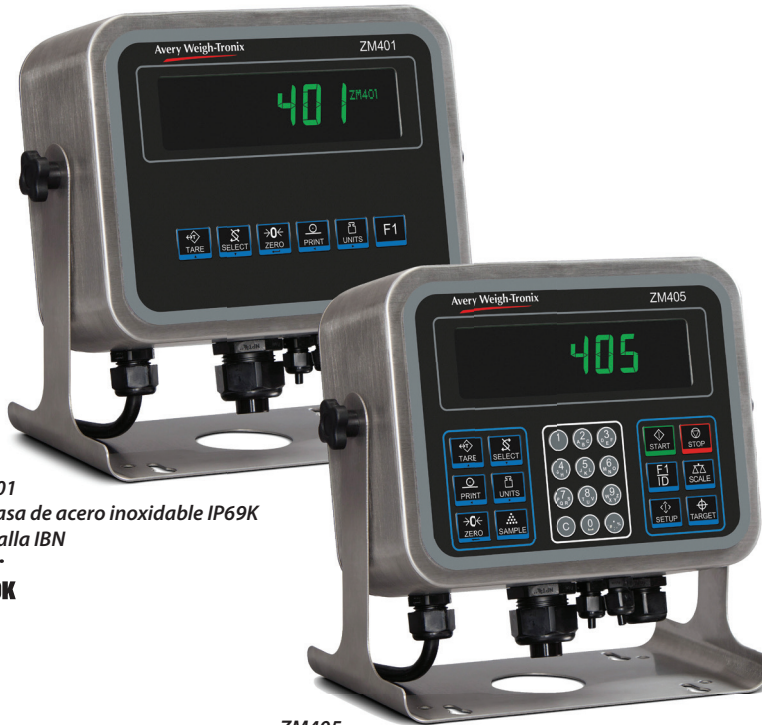
ZM401 Carcasa de acero inoxidable IP69K Pantalla IBN